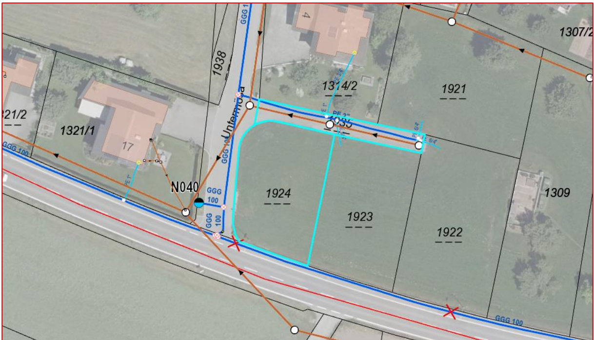
voll erschlossenes Baugrundstück (Wasser/Kanal)